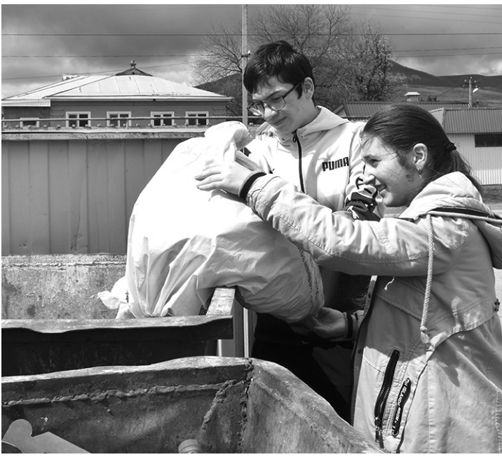
Учащиеся СОШ №1 а. Хабез наводят чистоту

КСТАТИ, помимо делегатов на съезде присутствовали представители Управления Минюста России по КЧР, Министерства КЧР по делам национальностей, массовым коммуникациям и печати, а также сотрудники других министерств, мэрия Черкесска, руководители сельских поселений КЧР, духовенство и представители общественных организаций. Среди почетных гостей были ветераны Отечественной войны народа Абхазии и военнослужащие СВО.