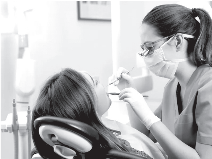
Для поддержания здоровья зубов необходимо регулярно посещать стоматолога

Здесь все зависит от частоты потребления сладкого и от того, как долго оно находится в полости рта. Если мы быстро проглотим одну конфету, то никакой кариеса не будет, разве что лишние калории придут. Но если мы будем долго прожевывать ириску, нугу или карамель, появится риск образования кариеса. Сладкое всегда делает более кислой PH-среду в полости рта, это ухудшает состояние зубов — они слабеют и быстрее портятся. При этом даже полный отказ от сладкого не гарантирует отсутствия проблем с зубами, ведь практически любая еда сказывается на зубах негативно. Поэтому после приема пищи рекомендуется чистить зубы.