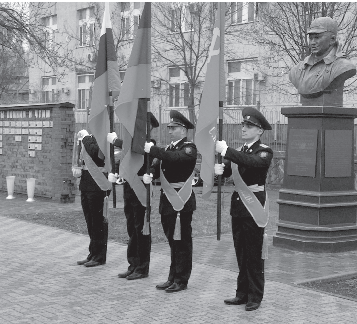
Знаменная группа на митинге в Черкесске